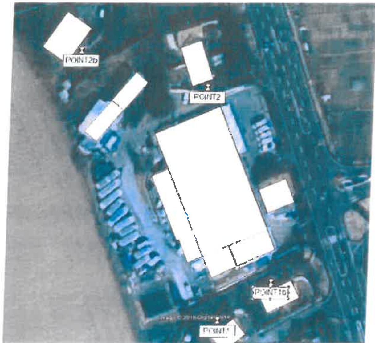
Figure 1. Modélisation acoustique du site de Saint Quentin